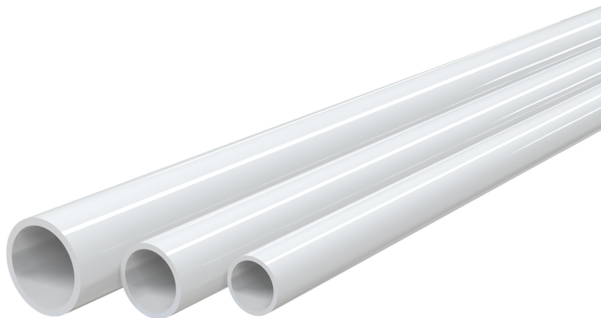
TCR-32 TCR-25 TCR-21

- cod. 11126324 - cod. SCD300034 - cod. SCD300016