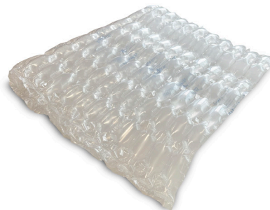
Pluriball di plastica riciclata LDPE 4