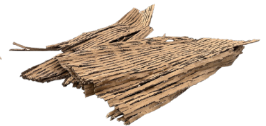
Fogli a fisarmonica di carta recuperata PAP 22