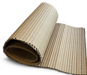
Cartone doppia faccia per imballo PAP 20