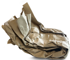
Carta riciclata per imbottitura PAP 20