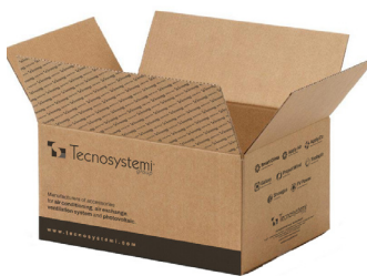
Scatola di cartone PAP 20