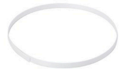
Regge in polipropilene PP 5