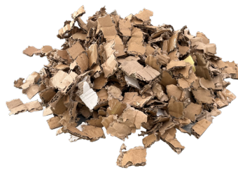
Chips di carta recuperata PAP 20