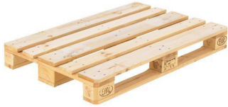
Pallet in legno FOR 50

Rendere chiara la composizione dei nostri imballaggi ti consentirà di smaltirli come rifiuto nel modo più corretto e semplice possibile. Ricordati di verificare sempre le disposizioni del tuo comune.