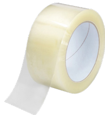
Nastro adesivo trasparente PP 5