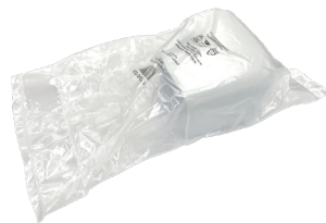
Sacchetto compostabile OTHER 7