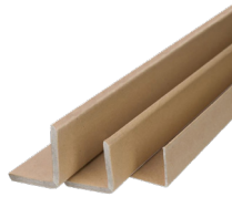
Angolare in cartone pressato PAP 21