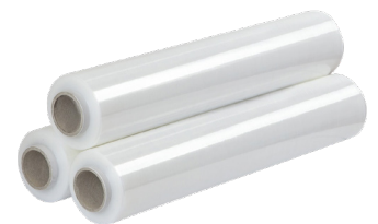
Estensibile LDPE 4