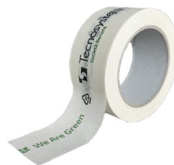
Nastro adesivo personalizzato PAP 22