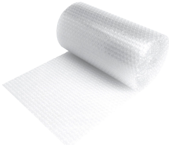
Pluriball di plastica LDPE 4